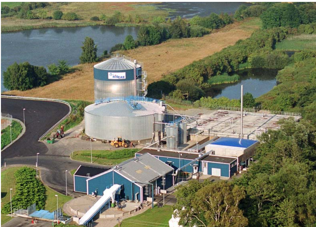
Figur 1 Biogasanläggningen i Kristianstad

Fakta/unikt: Aktörssamverkan, komplett biogassystem Först i Sverige med samrötning av matavfall, gödsel med flera substrat