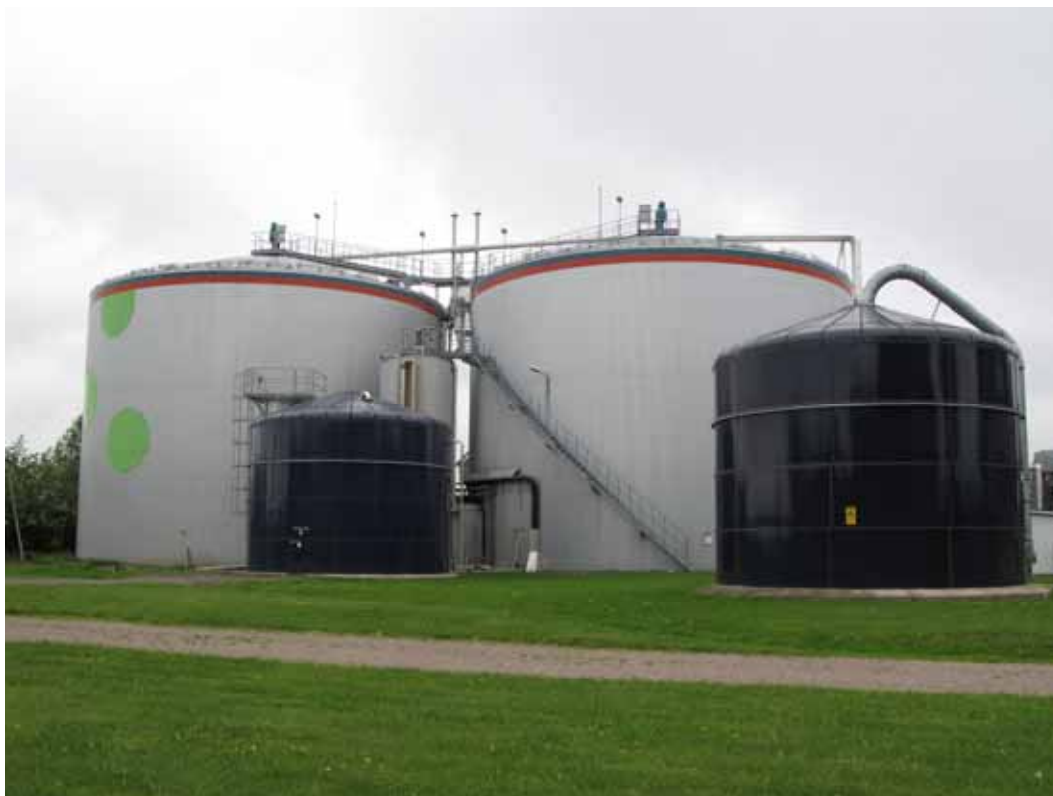
Bild 1 Rötkammaren är biogasanläggningens hjärta och består vanligtvis av en cylindrisk behållare av stål eller betong. Rötkammaren är isolerad och försedd med en omrörare för att kunna åstadkomma goda förhållanden för biogasproduktion. Bilden visar en biogasanläggning i Linköping

Den energibärande beståndsdel i biogas är metan. Biogas är ett miljövänligt och säkert bränsle med många användningsområden. Det vanligaste användningsområdet är förbränning av gasen i en gaspanna för att generera värme. Värmen kan användas för att hålla temperaturen i rötkammaren på rätt nivå samt till uppvärmning av tappvarmvatten och till lokaler. Metan kan också användas för att producera el. Vanligtvis sker el-konvertering i kolvmotorer med en verkningsgrad på 30-40 %. Biogas är det miljövänligaste fordonsbränslet på marknaden idag. Gasfordon kräver dock ett särskilt bränslesystem vilket gör fordonet något dyrare. Biogasen kan distribueras med naturgas, som också består av metan, i naturgasledningar och därmed finna en användning långt ifrån produktionsplatsen. Gas som inte finner någon användning måste facklas.